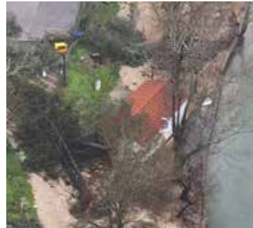
/ Praia Fluvial do Penedo Furado

Por outro lado, o circuito dos Passadiços do Penedo Furado já se encontra novamente acessível ao público. O percurso circular, com cerca de 2,1 quilómetros, deverá ser iniciado junto ao mi-