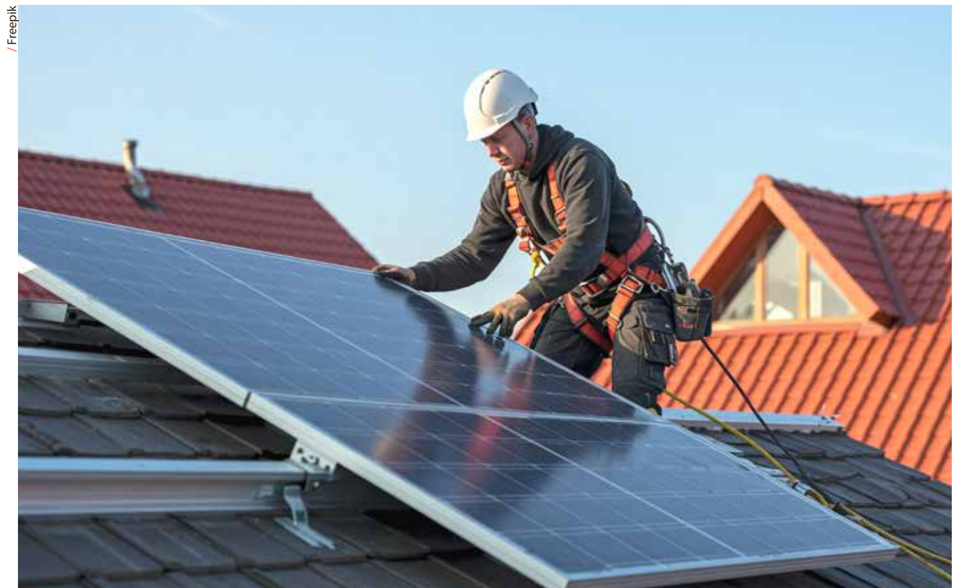
/ As CER vão ocupar, de preferência, telhados e coberturas