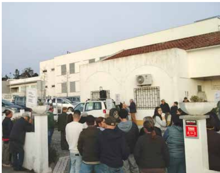
/ Concentração de populares no dia 20 de fevereiro

Depois, no dia 23 de fevereiro, na reunião da Junta da União Freguesias de S. Facundo e Vale das Mós, a população voltou a com-