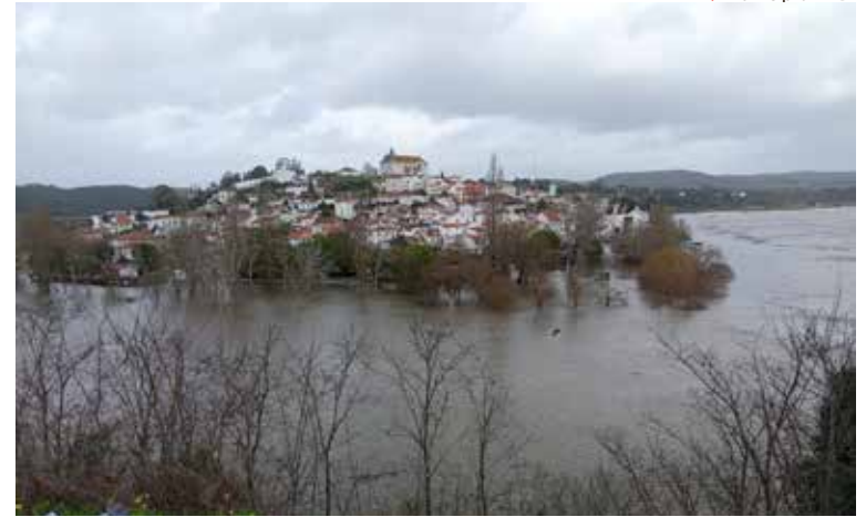
/ Município VNB

O Presidente da República visitou o posto de comando da Proteção Civil de Abrantes e a zona ribeirinha de Rossio ao Sul do Tejo e, mais tarde, a zona do Cartaxo.