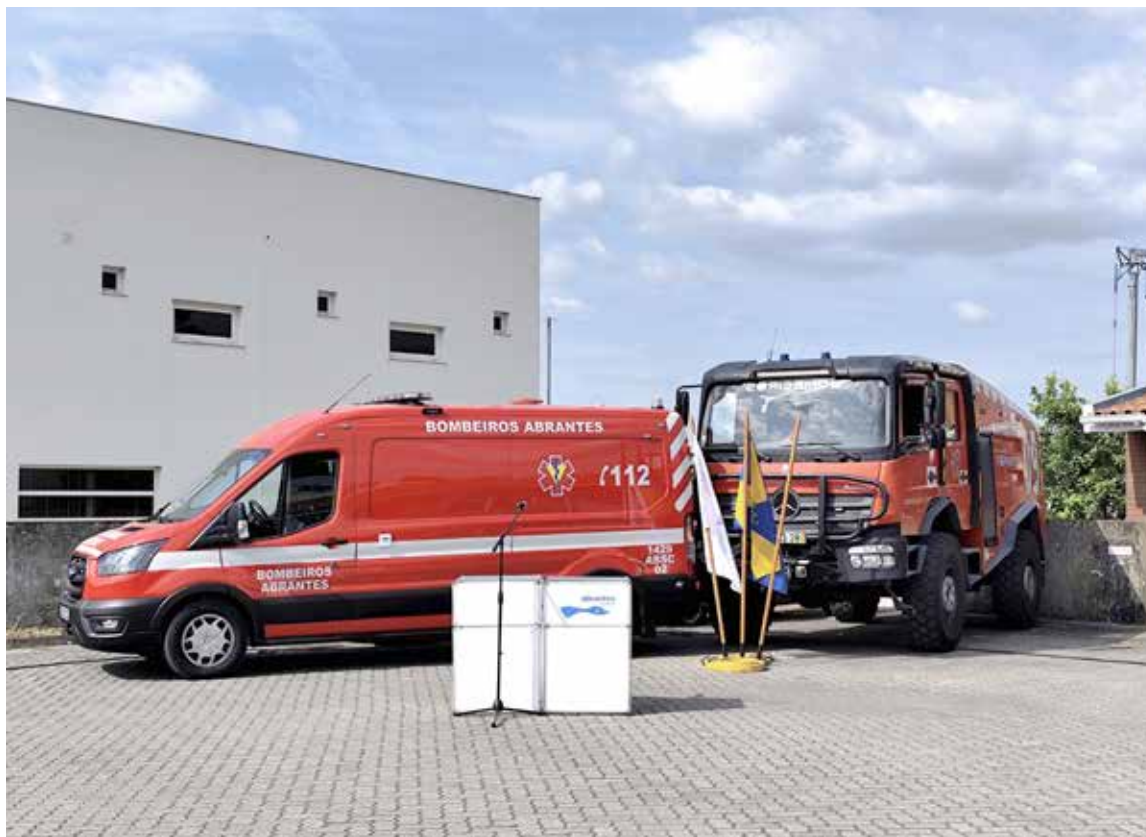
/ Posto Avançado de Tramagal conta com a permanência de uma ambulância

Na votação, os dois vereadores eleitos pela AD optaram pela abstenção visto não terem tido acesso ao relatório apresentado para uma melhor apreciação. “Esta abstenção não se trata de estar contra o financiamento que a Câmara possa fazer à Associação Humanitária dos Bombeiros Voluntários de Abrantes. Pren-