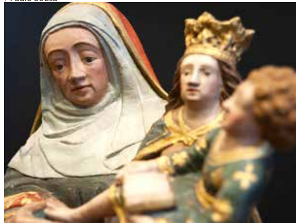
/ Arte Sacra de Sardeal vai estar em exposição no CCGV

Caridade, do séc. XVI, que está no Convento e “que nunca foi exposta”.