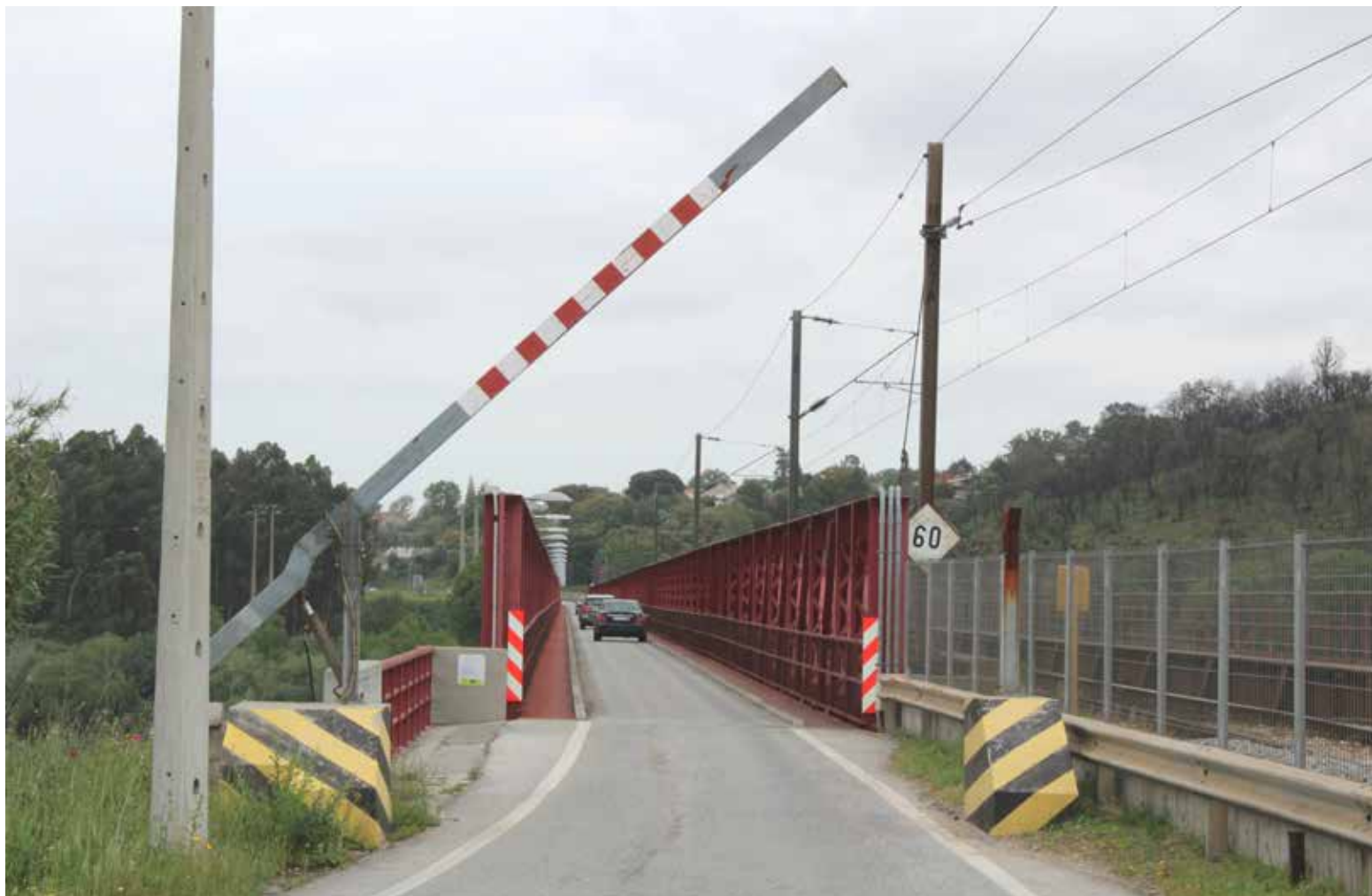
/ A ponte entre Praia do Ribatejo e Constância Sul é do século XIX, adaptada à rodovia na década de 80 do século XX

Quanto ao aumento do tráfego, o autarca reafirmou que “tem vindo a agravar-se. Não só a travessia por pesados, porque, obviamente, os pesados, sempre que não houver patrulhamento, vão tentar fazer a travessia. O que teria que ter quase, da parte das autoridades, um patrulhamento 24 sobre 24, na ponte, para que isto não