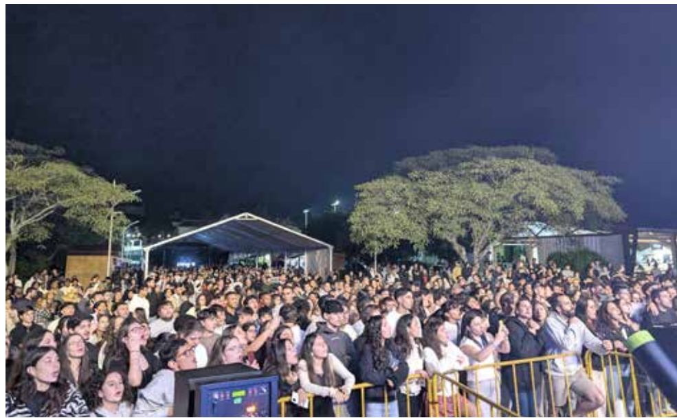
/ Festival Rock na Vila é um dos eventos cancelados