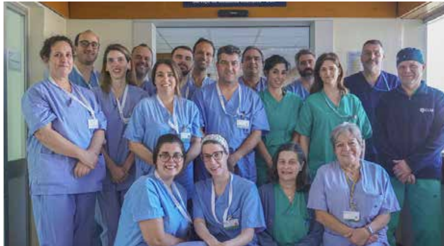
/ Equipa de colheita de órgãos da ULS Médio Tejo