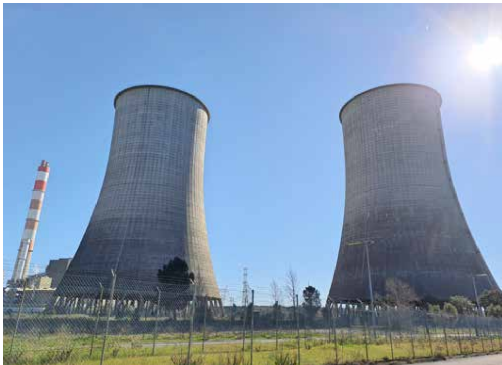
/ As torres de refrigeração, com 116 metros de altura, serão demolidas através do uso de explosivos.

Questionada sobre montante de investimento na ação de desman-