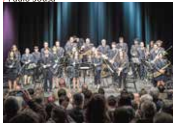
/ Concerto da Páscoa da Filarmónica União Sardealense

conseguirem ver um concerto da Banda, só a viam nas procissões. E o ano passado, também juntando o útil ao agradável, em parceria com o município, isto acabou por ser pensado e foi realizado já no sábado antes do domingo de Páscoa. E este ano vamos pelo mesmo caminho”.